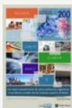
1. Encuesta ¿Cuál es el mejor banco de Argentina? Febrero 2016

A continuación, se detallan los reportes y encuestas ya elaborados y los que se desarrollarán durante 2016: