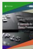
2. Reporte El mercado de Banca Premium Mayo 2016