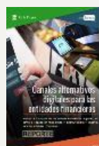
3. Reporte Canales alternativos digitales para las entidades financieras Agosto 2016