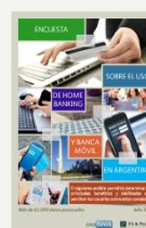
4. Encuesta Sobre el uso de Home Banking y Banca Móvil en Argentina Noviembre 2016