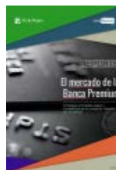
2. Reporte El mercado de Banca Premium Mayo 2016