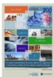
1. Encuesta ¿Cuál es el mejor banco de Argentina? Febrero 2016

A continuación, se detallan los reportes y encuestas ya elaborados y los que se desarrollarán durante 2016: