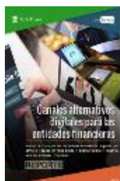
3. Reporte Canales alternativos digitales para las entidades financieras Agosto 2016

Otros reportes y encuestas a desarrollar durante 2016: